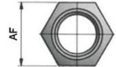
Tabelle 1: Unbeschichteter Stahl