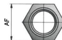
Tablica 1: nepremazani čelik